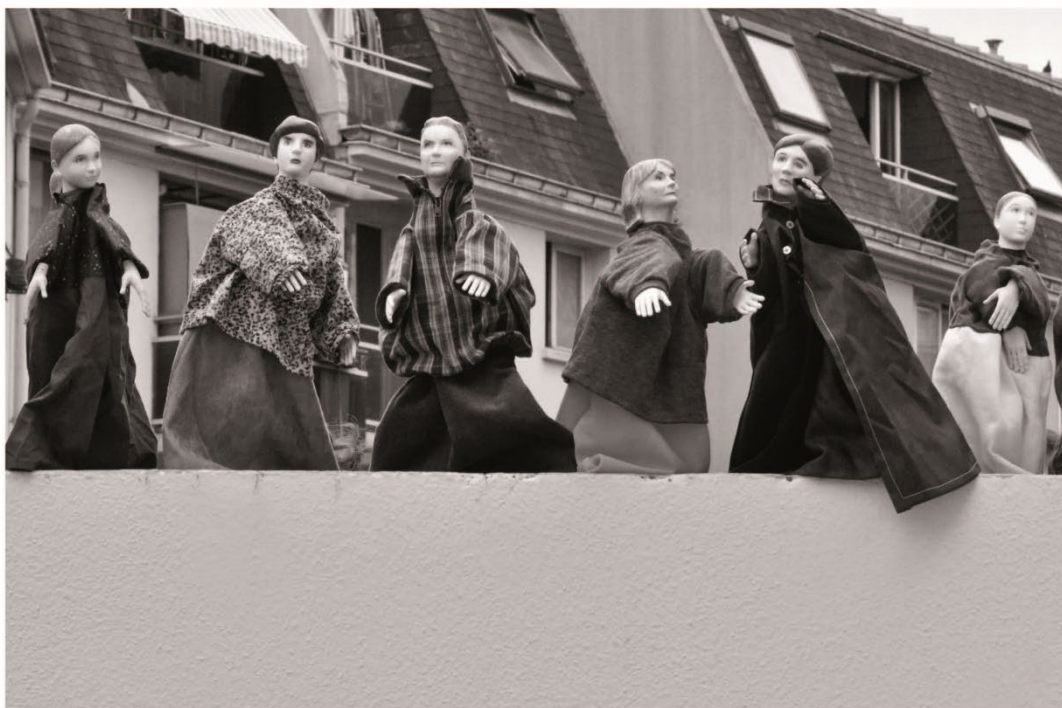
3. Marionnettes à gaines à l'effigie des habitant·e·s de Clamart.