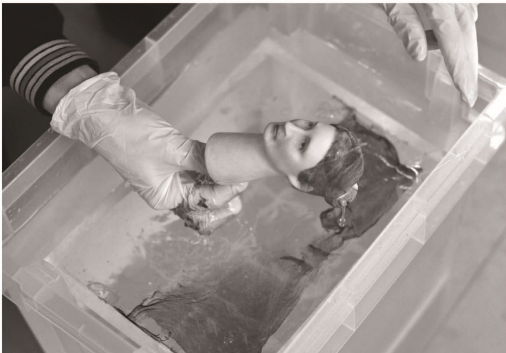
2. Les photos sont apposées sur les sculptures vierges grâce au principe d'hydrographie.