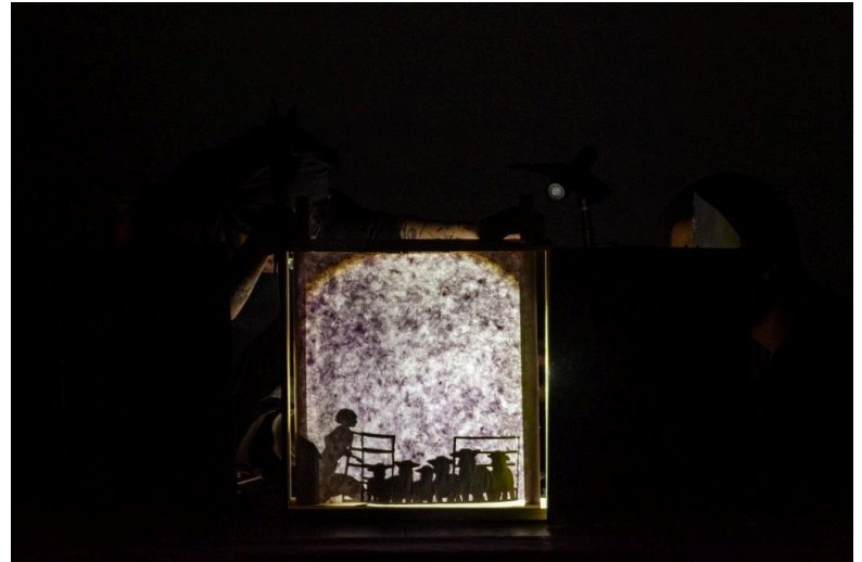
Subway Creatures: Rats and Negative Stereotypes Silence: Lambs and Animal Slaughter

Instagram: @hannfriends Website: samnfriends.com