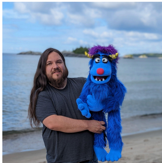
Figure 1. Baabii, la marionnette, enseigne l'anishinaabemowin à la Première nation Michipicoten, dans le nord de l'Ontario, au Canada.