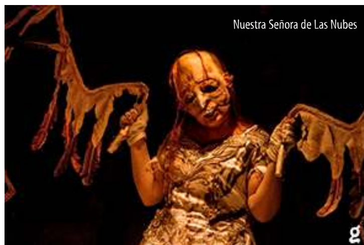
Nuestra Señora de Las Nubes