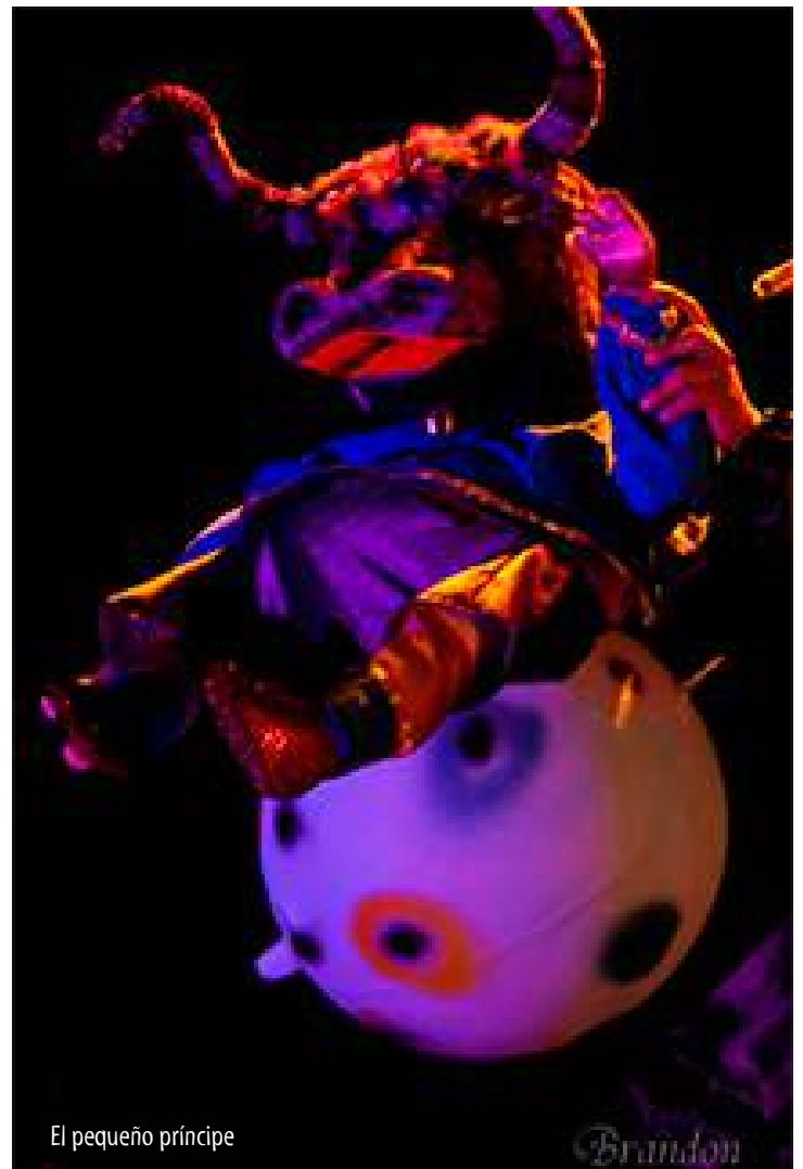
El pequeño príncipe

Consultas sobre la obra de Salvador Lemis en: www.ficciones-analogiam.com