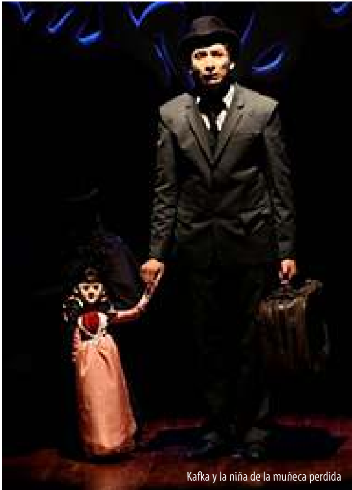
Kafka y la niña de la muñeca perdida

Obras suyas como La Niña Catrina , La dictadura del rey Pepino , Konrad , Galápago , Kafka y la niña de la muñeca perdida , El extraño caso de los espectadores que asesinaron a los títeres , Retablo de las Maravillas de la fundación de Puebla de los Ángeles , El pequeño príncipe , Momo , Mozart , Tres Tazas de Trigo , Eréndira , entre otras más, han sido publicadas o llevadas a escena en suelo mexicano. Su dramaturgia ha tenido repercusión en Cuba y países como Alemania, España, Egipto, Guatemala, Chile, Venezuela, Ecuador, Colombia, USA y México, entre otros países.