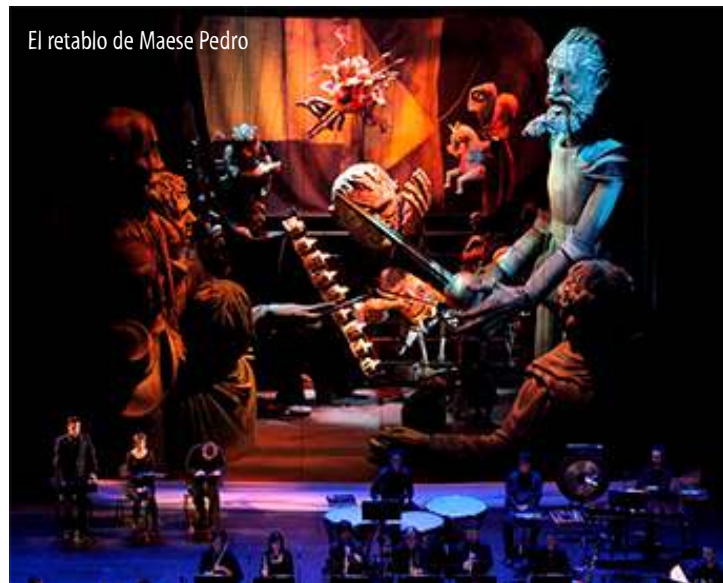
El retablo de Maese Pedro

Nouvelle, París (Instituto de Estudios Teatrales). En esta universidad, París III, cursa dos Masters en Arte Teatral, investigando sobre el teatro de títeres contemporáneo (Teatro Gioco Vita, y las influencias asiáticas en la escena titiritera contemporánea francesa).