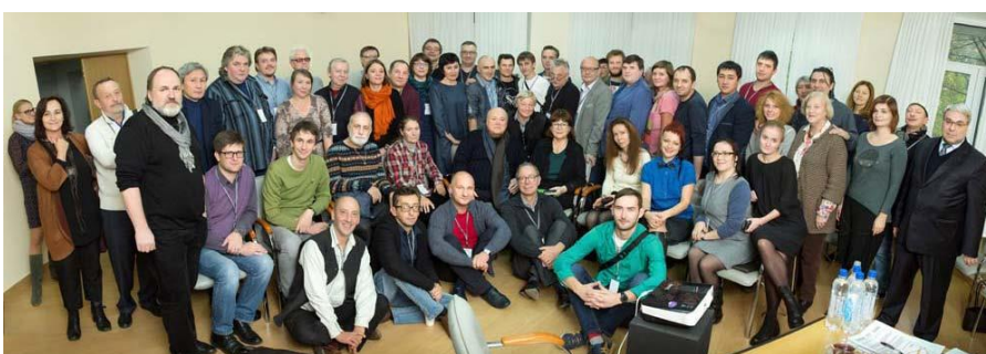
La Conférence des metteurs-en-scène des théâtres de marionnettes au Festival Obratsov en 2016