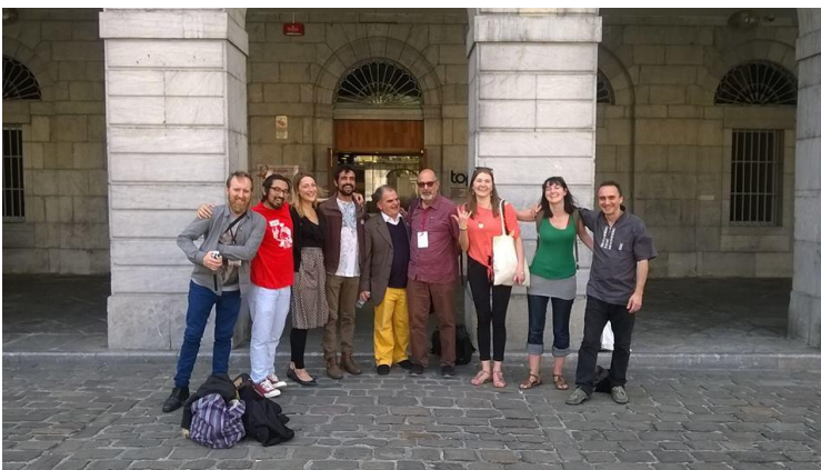
La Commission de la Jeunesse de l'UNIMA au Congrès Mondial de 2016

2) La Commission de la Jeunesse de l'UNIMA continuera à effectuer l'un de ses objectifs principaux : attirer les jeunes membres de l'UNIMA à s'intégrer dans leurs centres nationaux, en leur parlant du projets de l'UNIMA pour les jeunes et en encourageant des candidats à chercher eux-mêmes un financement pour leurs voyages à l'étranger aux événements de l'UNIMA . Notre commission est prête à vous aider et vous orienter par rapport aux options possibles de subventions / fonds nationaux et internationaux. Ce soutien informatique s'effectue par le courriel; et on est prêt à vous aider à prendre contact avec vos locaux centres nationaux de l'UNIMA.