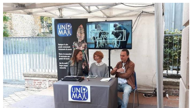
La présentation de la Commission de la Jeunesse de l'UNIMA le 18/09/2017 à Charleville-Mézières