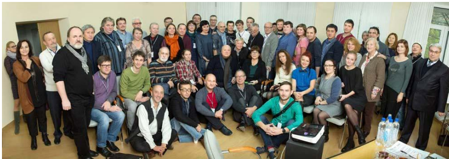
Comisión de Juventud en el Congreso Mundial UNIMA, Tolosa, mayo- junio de 2016