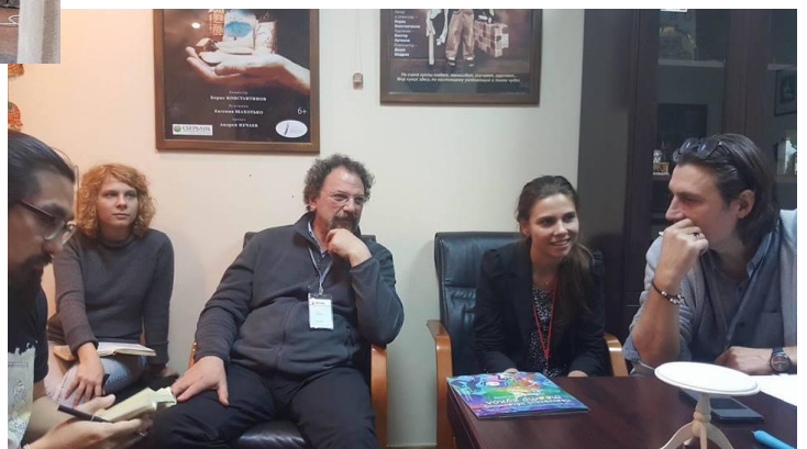
Reunión de la Comisión de Juventud, Moscú, octubre de 2016