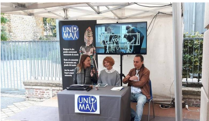
Presentación de la Comisión de Juventud, Charleville-Mézières, 18 de septiembre de 2017