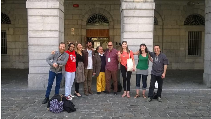
Comisión de Juventud en el Congreso Mundial UNIMA, Tolosa, mayo- junio de 2016

2) UNIMAYC tiene como propósito cumplir con uno de nuestros principales objetivos: atraer a los jóvenes miembros de UNIMA a sus centros nacionales y a las comisiones internacionales, estimulando a los solicitantes a encontrar fondos para sus viajes por su cuenta, con métodos y consultas que estamos dispuestos a proporcionar por correo electrónico y con la ayuda de los propios centros nacionales de UNIMA.