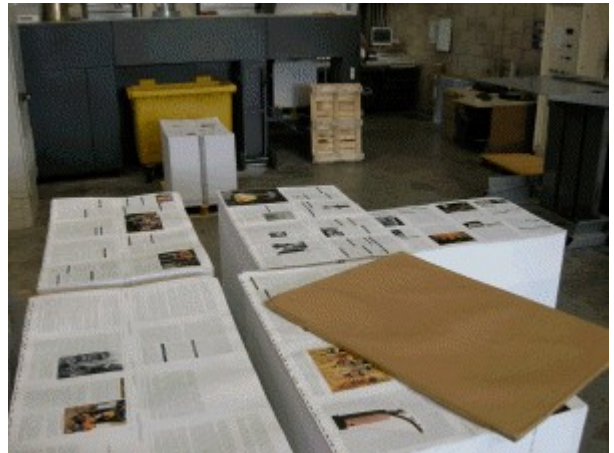
L'Encyclopédie arrive !

Un rêve de trente ans enfin réalisé ! Un exemplaire sera donné à chaque Centre UNIMA. Pensez à acquitter de votre cotisation, si ce n'est déjà fait.